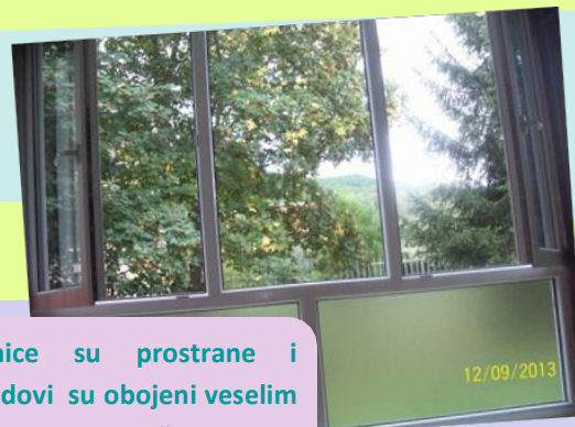
Naše učionice su prostrane i prozračne. Zidovi su obojeni veselim bojama koje podstiču toplu atmosferu.