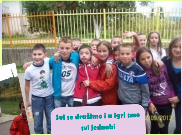
Svi se družimo i u igri smo svi jednaki