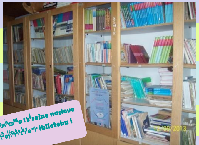
Imamo i brojne naslove biblioteke i