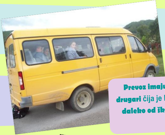
Prevoz imaju i drugari čija je kuća daleko od škole