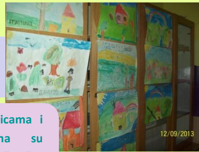
U učionicama i hodnicima su izloženi učenički radovi