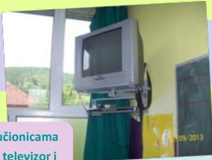
U nekim učionicama se nalaze televizor i DVD