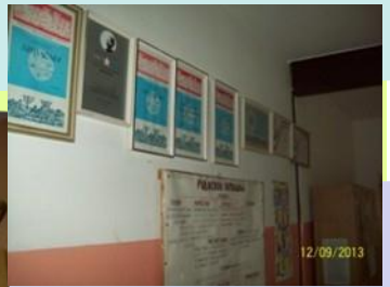
Brojni pehari i diplome govore o uspjesima naših učenika i škole u cjelini