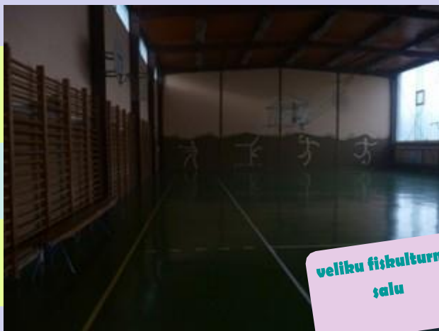
veliku fiskulturnu salu