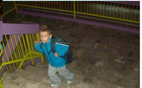
Na putu do učionice zna se red, stepeništa su široka, pa se ne metano mimolazimo.