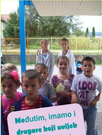
Međutim, imamo i drugare koji uvijek stoje po strani