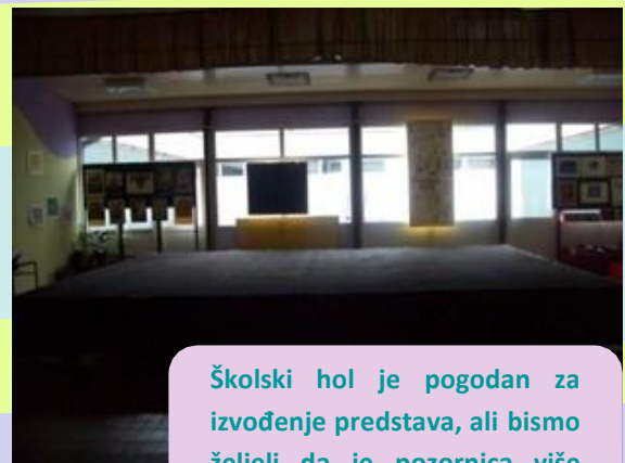
Školski hol je pogodan za izvođenje predstava, ali bismo željeli da je pozornica više osvijetljena