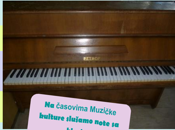
Na časovima Muzičke kulture slušamo note sa klavira