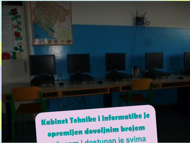
Kabinet Tehnike i informatike je opremljen dovoljnim brojem računara i dostupan je svima